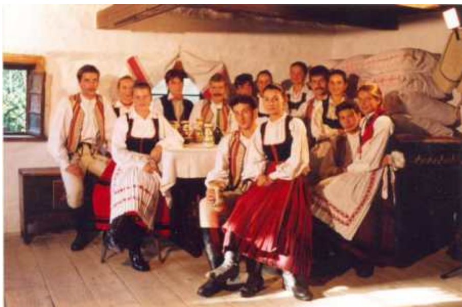
A húszéves Pipacsok...